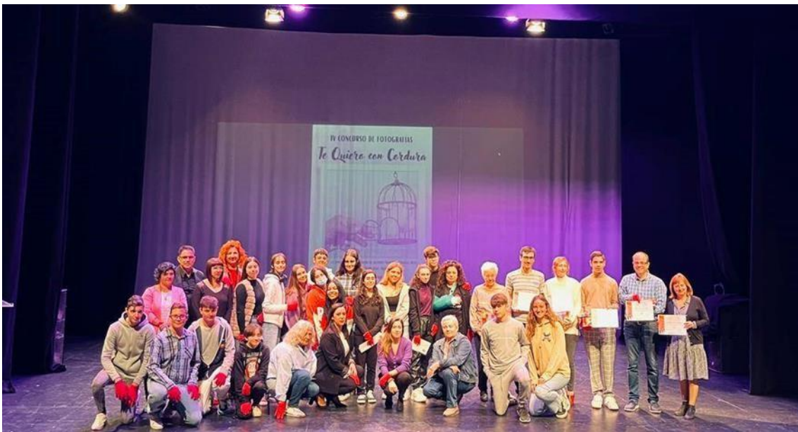
Entrega de premios del IV Concurso Fotográfico "Te quiero con cordura"

A continuación, dejamos enlaces a las bases de ambas ediciones, así como a los calendarios y al acto de presentación y entrega de premios.