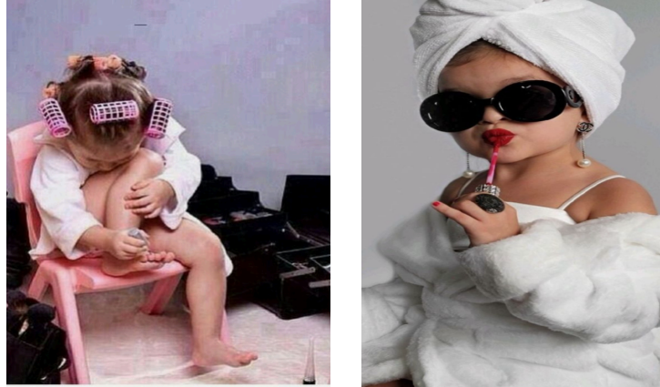
Figura 1- kidfluencing, o mini beauty influencers. (Fotos libres sin derecho de autor)

Muchas chicas piensan que tener el primer sangrado es símbolo de que ya “es una mujer” y comienzan a aparentar serlo sin serlo, y aquí el patriarcado se aprovecha desde tempranas edades en crear productos medioinfantiles del tipo: lips labiales, sombras de ojos purpurinas, minimaquillajes y vemos en redes niñas menores incluso antes de su menarquia haciendo lo que ven: Cómo maquillarse y autocuidarse, es lo que se le llama ahora