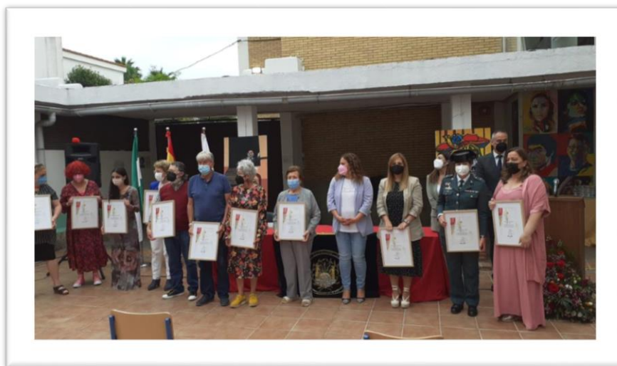
Ilustración 4 Imagen del acto inaugural en el que figuran las mujeres homenajeadas o algún familiar.

Finalmente, durante el tercer trimestre finalizamos el proyecto de nuestro grupo de trabajo con la inauguración de esta primera planta una vez que estuvieron colocadas todas las infografías y demás elementos decorativos. Para ello realizamos un acto en el patio de nuestro centro al que asistieron la mayoría de las doce mujeres homenajeadas en las infografías y/o sus familiares, así como personalidades del mundo de la política a nivel local. El acto y el proyecto tuvieron tal repercusión que se hicieron eco medios de comunicación locales e incluso autonómicos. (Ilustración 4)