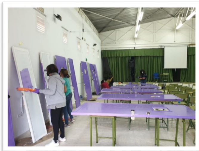
Ilustración 1 Pintura de puertas violetas en el salón de actos del centro.

carrocero por ambos pasillos, dando las dos capas de ambos tonos de gris, recortando por los recovecos, limpiando, recogiendo, etc. (Ilustración 2)