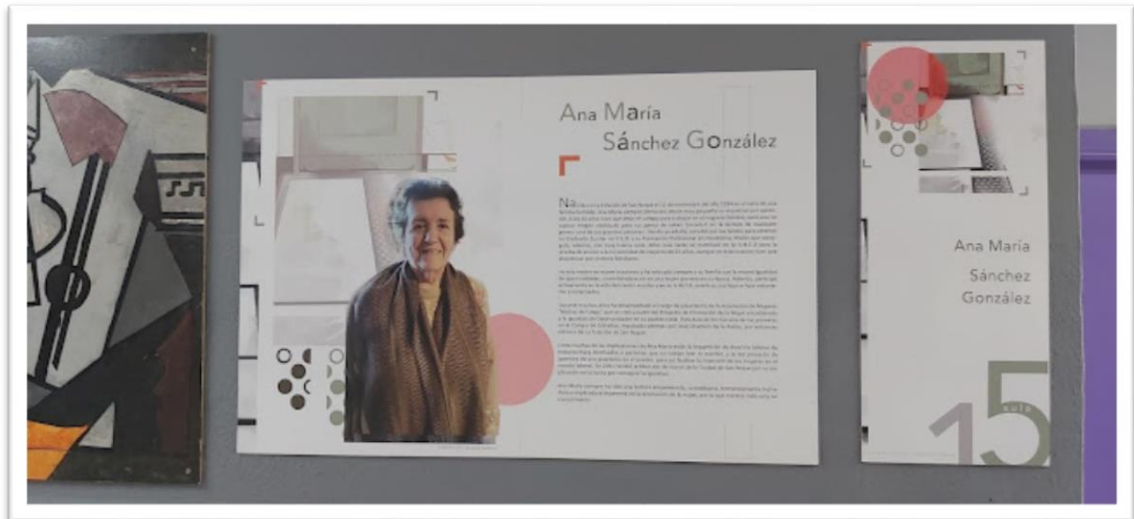
Ilustración 3 Infografía y cartel con el número y el nombre del aula de una de las mujeres del proyecto.

Sus biografías, mucho más detalladas, con todos sus logros y datos significativos, pueden encontrarse tanto online en la web de nuestro centro IES José Cadalso: https://iesjosecadalso.es/coeducacion-2/ como de forma presencial en las paredes de los pasillos de nuestro instituto. (Ilustración 3)