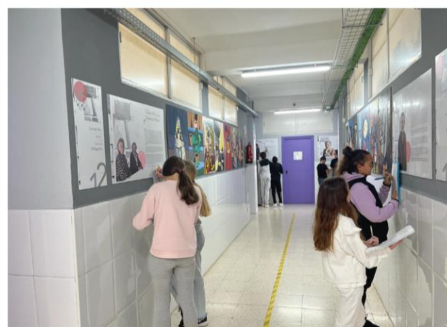
Ilustración 5 Alumnado de 1º de la ESO participando en la actividad "¿Quién soy?"